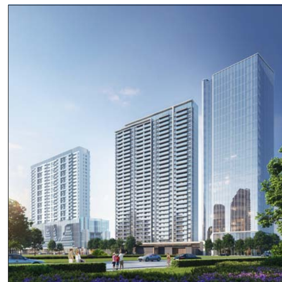
单体效果图(仅为示意)