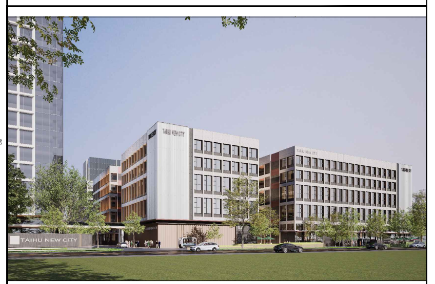
单体效果图（仅为示意）