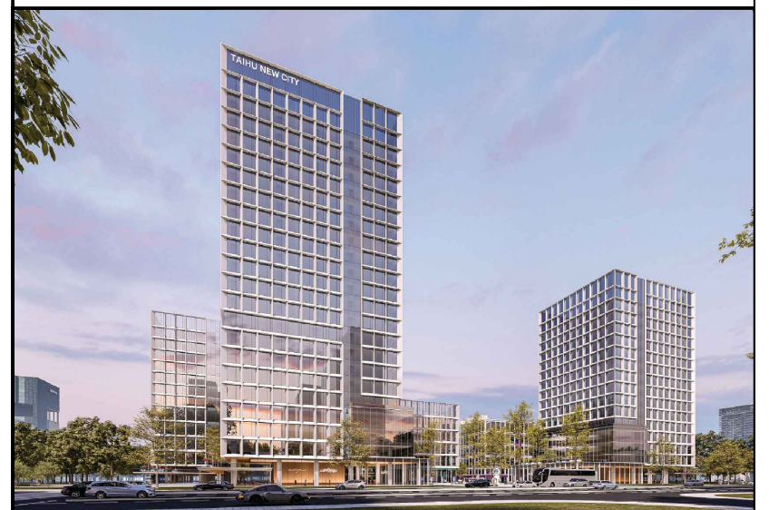
单体效果图（仅为示意）