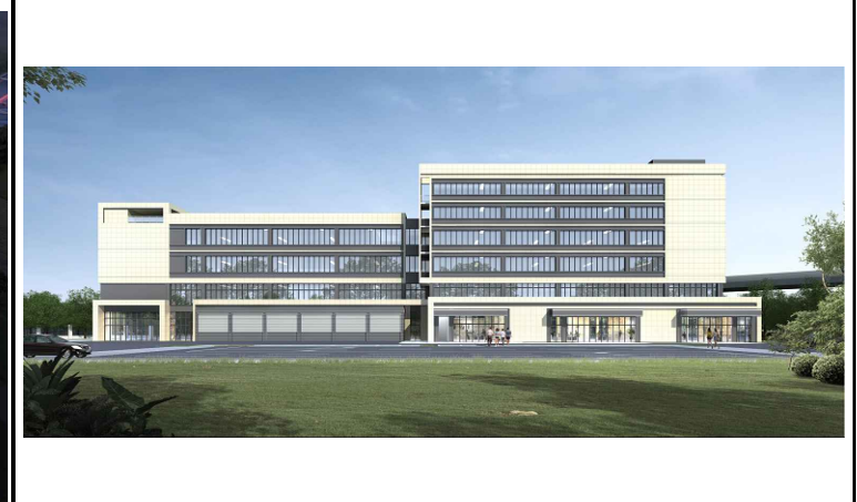
单体效果图（仅为示意）