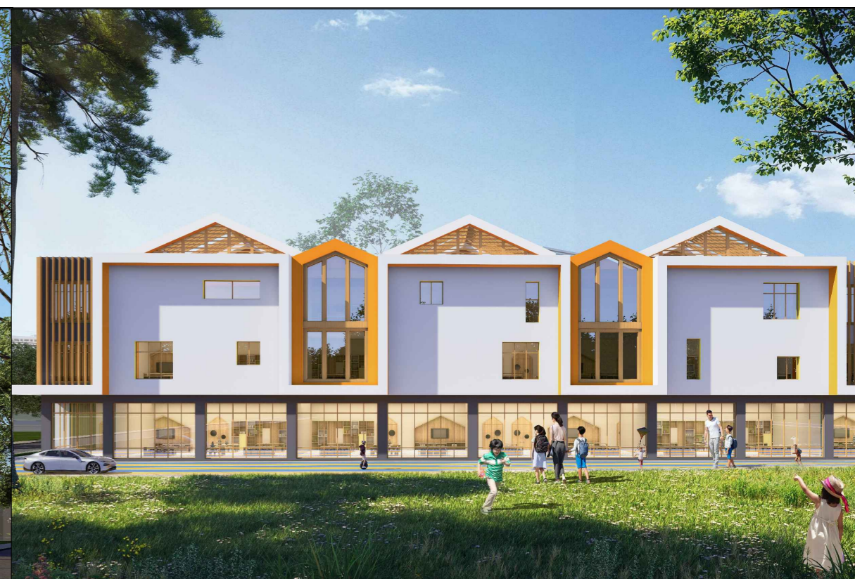
单体效果图（仅为示意）