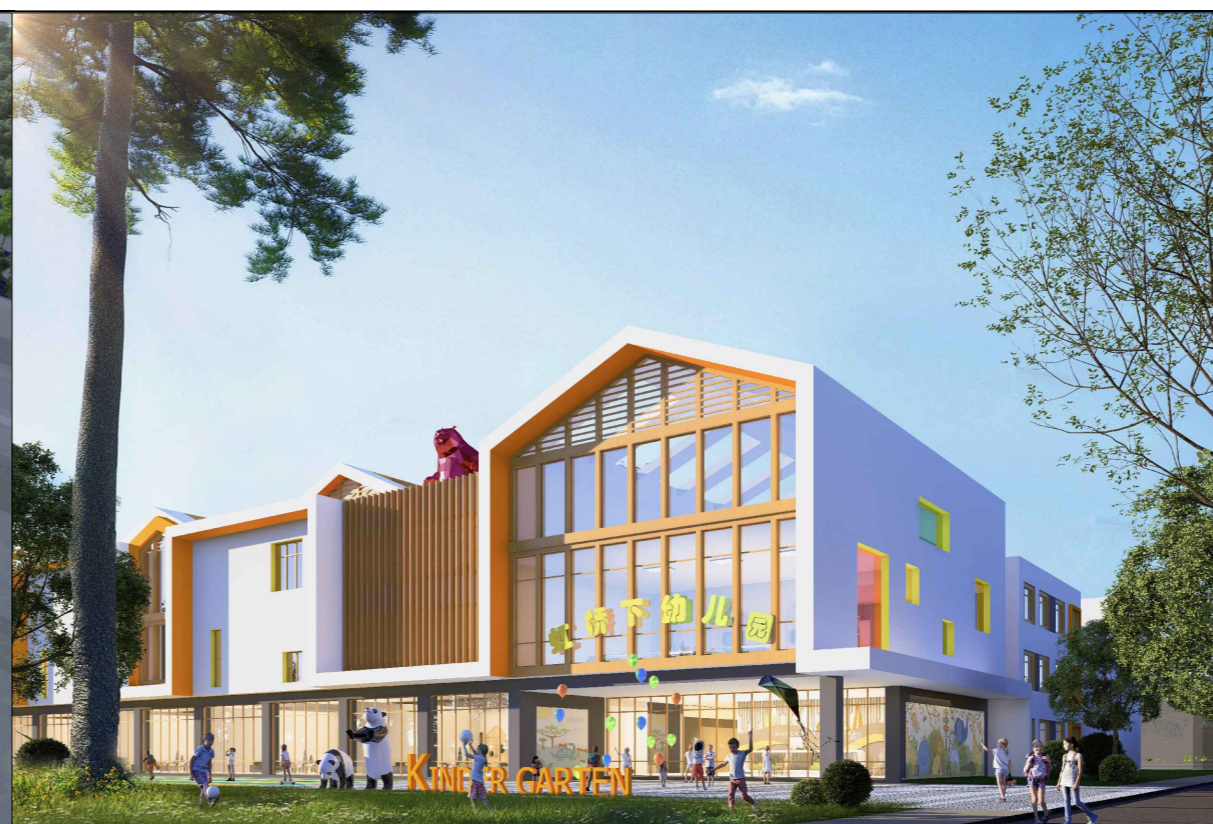
单体效果图（仅为示意）