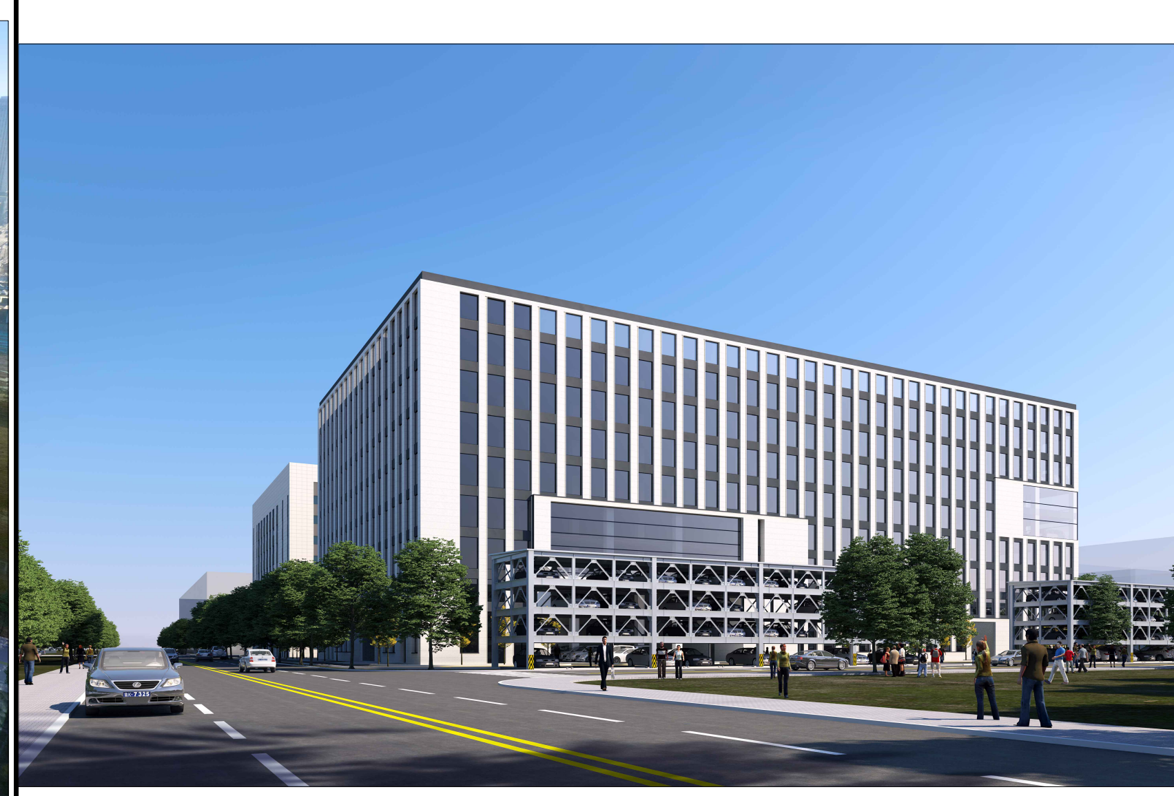
单体效果图（仅为示意）