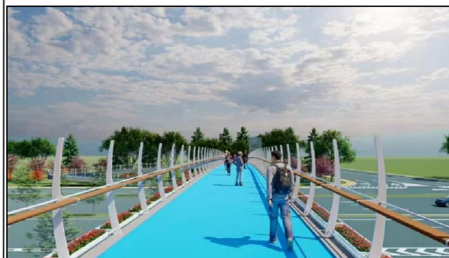
人行视角图（仅为示意）