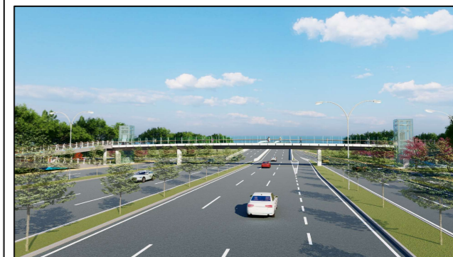
车行视角图（仅为示意）