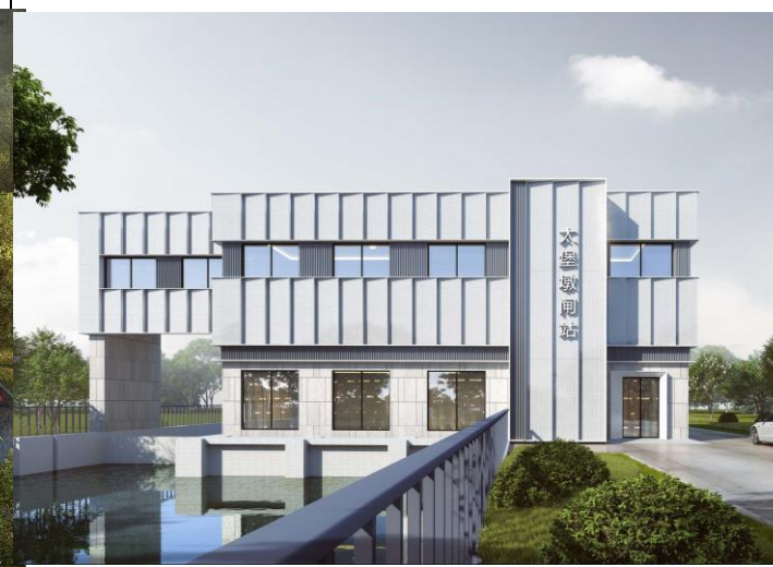
内河侧视图（仅为示意）