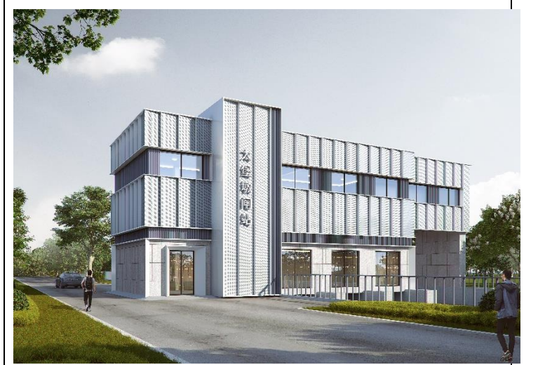
外河侧视图（仅为示意）