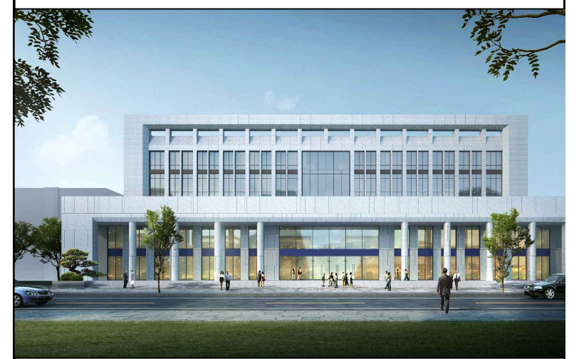
单体效果图（仅为示意）