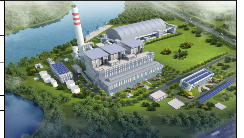
全厂鸟瞰图（仅为示意）