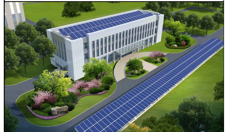
生产附属楼效果图（仅为示意）